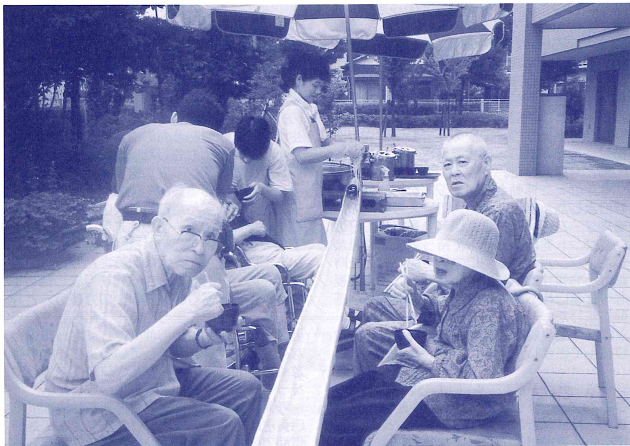
7月の行事 流しそうめん

発行/ 社会福祉法人 マザアス 特別養老ホーム マザアス東久留米 高齢者在宅サービスセンター マザアス刈谷 〒203-0004 東久留米市氷川台二丁目5-7 ☎0424-77-7261 FAX77-7500 発行責任者 高原 敏夫 編集責任者 山崎 宣子