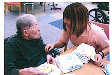
ご利用者と談笑中の浜砂ケアワーカー